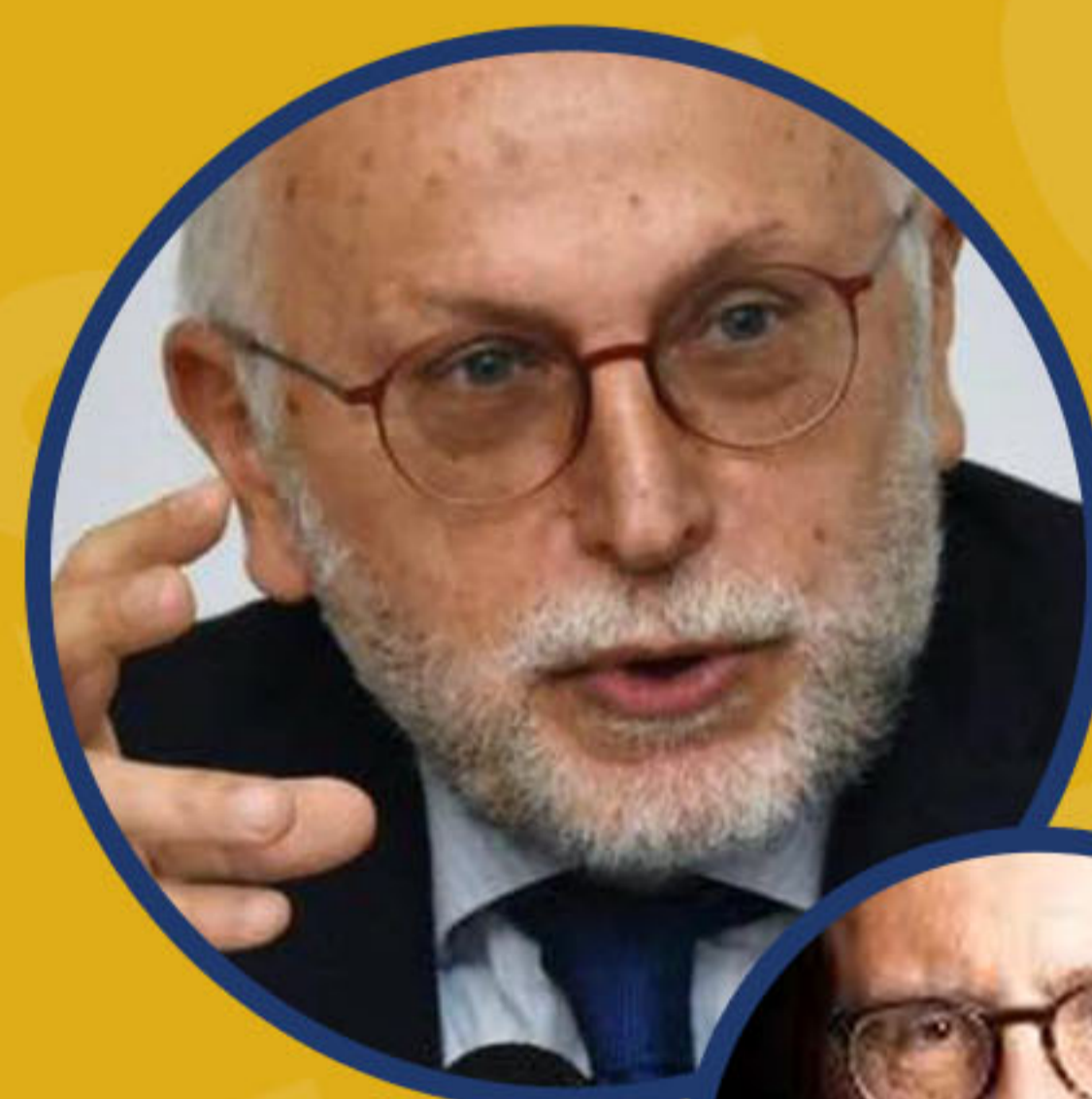
L'AUTORE GIORGIO VITARI magistrato